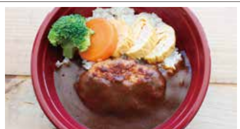
⑦カレーハンバーグ丼 500円(税込) 普通盛 大盛り ふんわり柔らかな手作りハンバーグをカレーにトッピング! スパイシーな大人味。