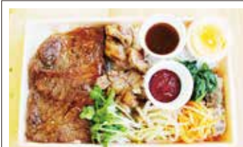
⑪焼肉弁当 1,200円(税込) 普通盛 大盛り たっぷりの牛ロース肉を数種のナムルと辛さとコクのコチュジャンと一緒に。たまには贅沢なお弁当、いかがですか?