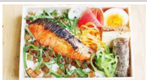
⑧鮭弁当 700円(税込) 普通盛 大盛り 炭火で香ばしく焼き上げた鮭とさっぱりとした大葉と大根でご飯がすすむ事間違いなし。