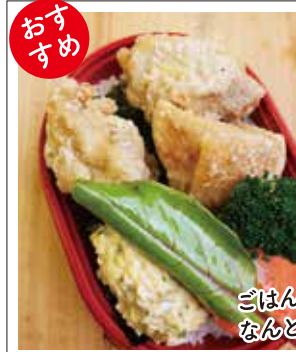
②塩唐揚げタルタルソース 500円(税込) 鶏肉は大きめカットで脂を感じるジューシー仕上げ。塩とごま油のあっさりとした味付けが、マヨネーズから手作りするタルタルと好相性。唐揚げの旨味がしみ込んだ海苔と存在感のあるタルタルがシンプルな弁当を盛り上げます☆ ごはん大盛りチョイスでなんと唐揚げがもう1個! 普通盛 大盛り