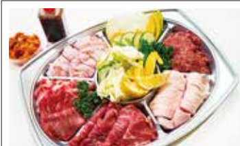
⑫すごい焼肉セット(3~5人前) 5,000円(税込) *3日前まで要予約 *受け取りは11:00~13:00 野菜6種・肉1050g…豚肩・豚トロ・津軽鶏・牛タン・牛カルビ・牛バラ(たれ・キムチ付)