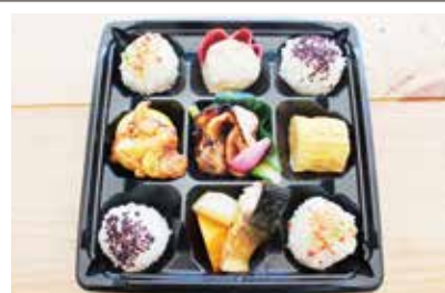
①日替わり幕ノ内弁当 500円(税込) 悩んだらコレ! 5つの惣菜は日替わりで肉・魚・煮物や揚げ物等でバラエティ豊か。 普通盛 大盛り

※おまかせ弁当・ケータリングはご要望に応じます ※仕入れ状況により食材が変更になる場合があります。