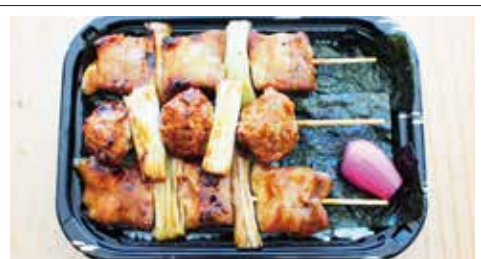
④炭火焼きの豚串弁当 500円(税込) 普通盛 大盛り 厚めの豚バラを蒸してから炭火で丁寧に焼き上げました。つくねとトロネギも絶妙。