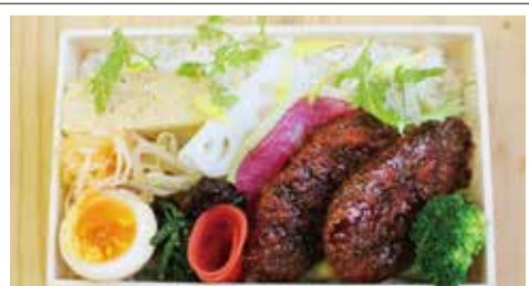
⑨やわらか豚ヒレカツブラック 700円(税込) 普通盛 大盛り 食べ応え満点弁当! ソース味のご飯と相まって満腹感増幅。いまべんのボリュームラインです。