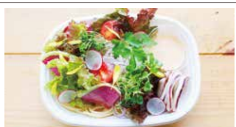
⑥烏賊メンタイサラダパスタ 500円(税込) 普通盛 大盛り 生クリーム入りのなめらかソースで野菜がデリーに变身! 控えめなパスタでお腹も満たされます。