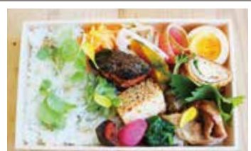
⑩幕ノ内弁当 1,000円(税込) 普通盛 大盛り 魚・肉・野菜のバランスが良い毎日食べたいヘルシーなお弁当。手作りいまべんのこだわりをぎゅっと詰め合わせ☆