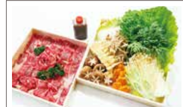
⑬すごいすき焼きセット(3~5人前) 5,000円(税込) *3日前まで要予約 *受け取りは11:00~13:00 野菜7種・焼豆腐・糸こんにゃく・牛肩ロースすきやき用700g(たれ付)