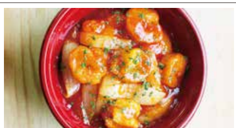
⑤エビチリ丼 500円(税込) 普通盛 大盛り 手作りソースの下にはまさかの薄焼卵衣をまとった海老と存在感のある玉ねぎが良き。